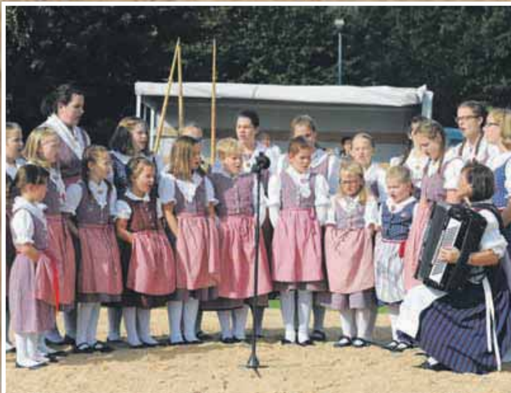
Die Kleinsten standen nicht nur sportlich im Fokus, sondern sorgten auch für musikalische Unterhaltung.